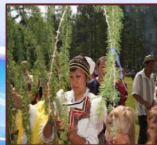
Вязание ленточек на счастье (ритуал праздника, 2012 год)

Если раньше спортивное состязание включало в себя бега на оленях, то сейчас на бегах используют лошадей.