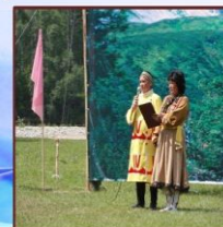
Праздник Аргамчи-Ыры, 2012 год