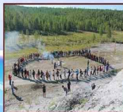
Обряд поклонения священной для всех звенков Белой горе, 2013 год

Большер - традиционный национальный праздник звенков. Большер проводится в столице Бурятии один раз в два года. Он демонстрирует многоликую самобытную народную культуру звенков России.