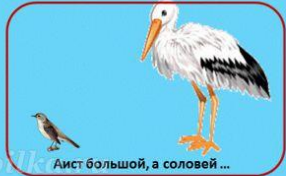
Аист большой, а соловей ...