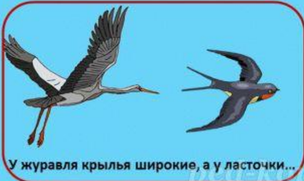
У журавля крылья широкие, а у ласточки...