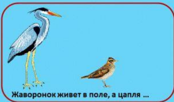
Жаворонок живет в поле, а цапля ...