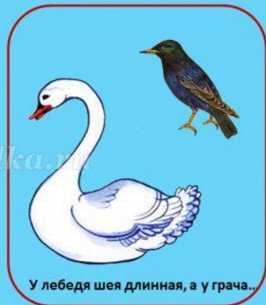
У лебедя шея длинная, а у грача...