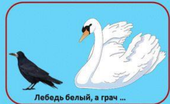
Лебедь белый, а грач ...