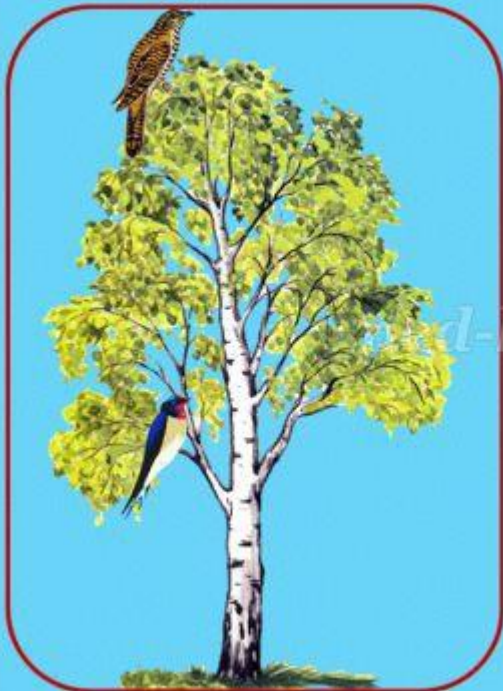
Кукушка сидит высоко, а ласточка ...