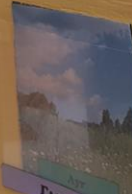
Луг Где живут?