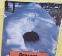
Берлога Где живут?