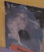
Берлога Где живут?