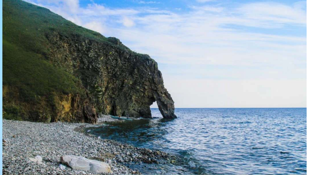
"Хобот" скала на Байкале.