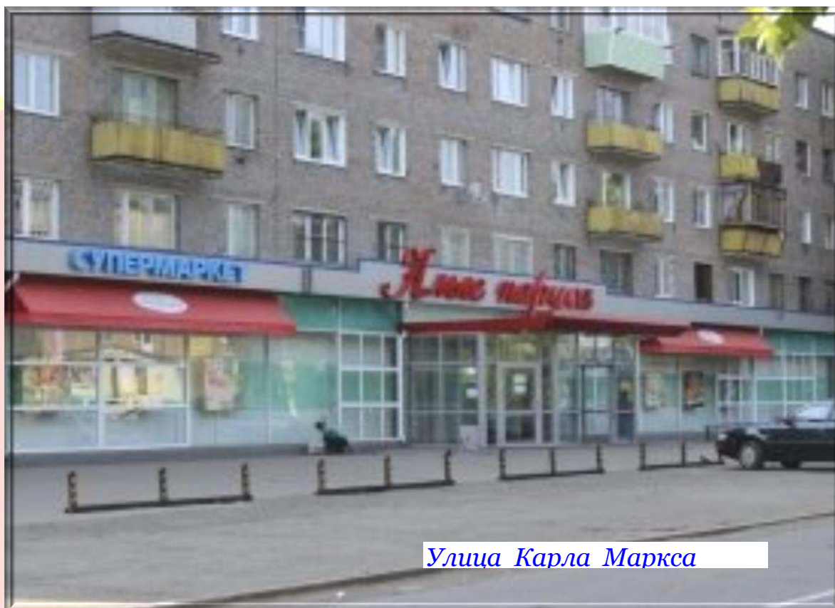
Улица Карла Маркса

Карл Маркс (1818-1883) – мыслитель и общественный деятель, основоположник марксизма. Родился 5 мая 1818 года в Германии. В 1835 – 1841 гг. учился на юридическом факультете университетов в Бонне и Берлине. В 1843 г. переехал в Париж, активно участвовал в работе международной организации «Союз коммунистов» и вместе с Ф.Энгельсом написал его программу – «Манифест Коммунистической партии». В августе 1849 г. переехал в Лондон. Маркс был лидером и организатором 1-го интернационала. В 1867 г. вышел главный труд Маркса – «Капитал».