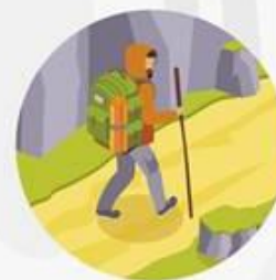
Надёжная одежда и обувь