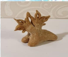
«Олень венчальный» — значит, впереди настоящая