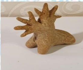
«Олень двурогий» — символ здоровья и долголетия.