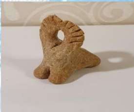
«Олень-солнце» — хранитель семейного очага.

Для фигурок характерны условность и обобщенность, лишь рога вылепливаются по-разному т.к. все образы имеют свой смысл. ( ниже представлены самые распространенные козули ).