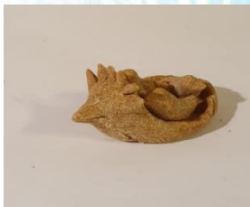
«Тетерка-утица» — знак материнства.